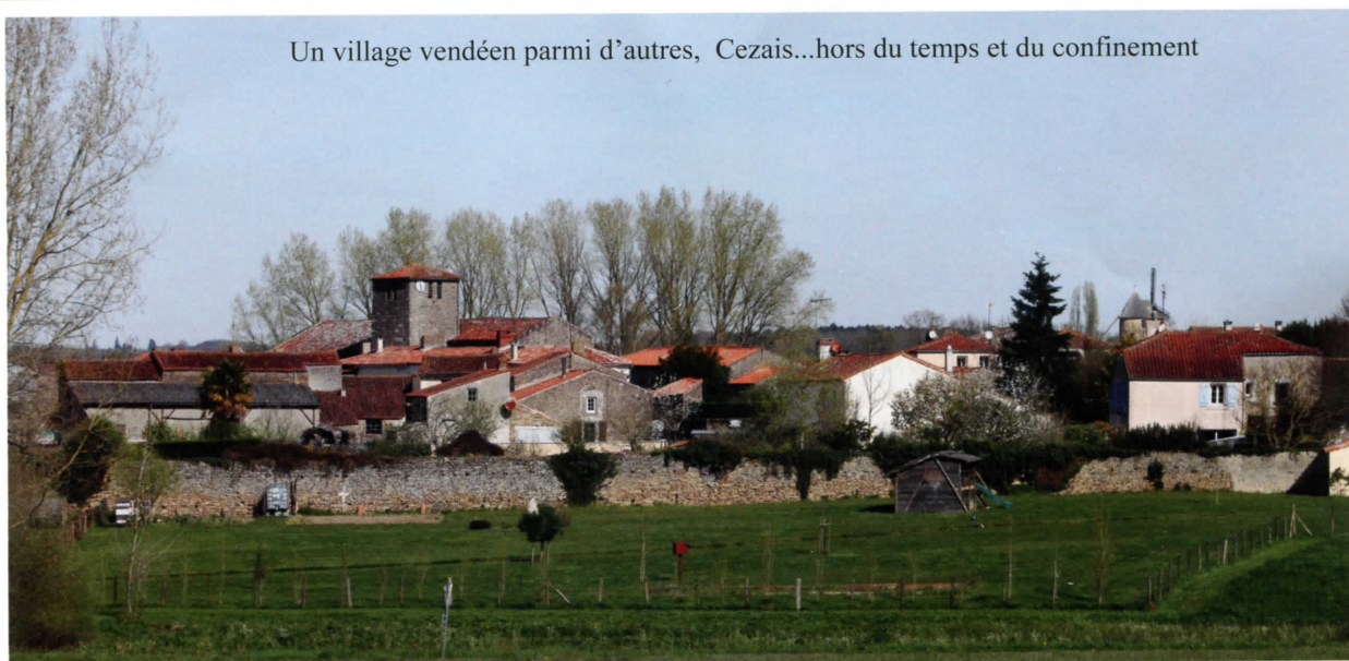
Un village vendéen parmi d'autres, Cezais...hors du temps et du confinement