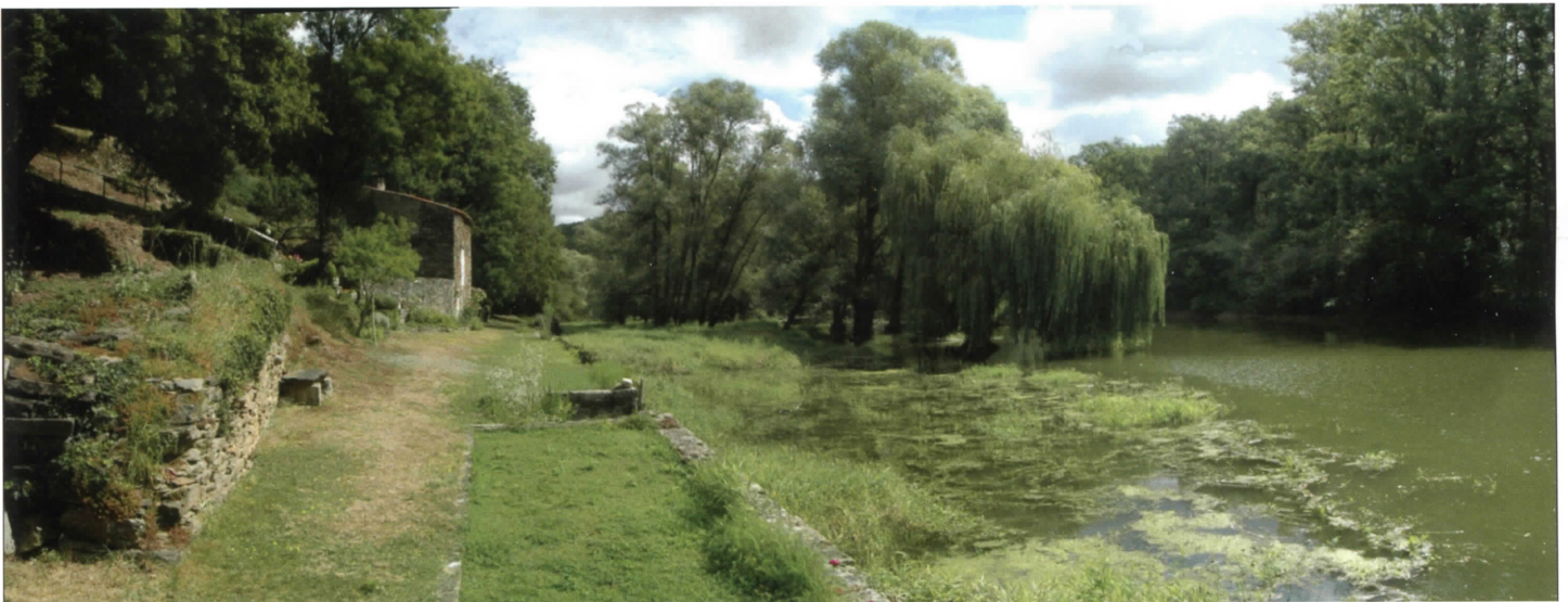
La jardinière de la mémoire